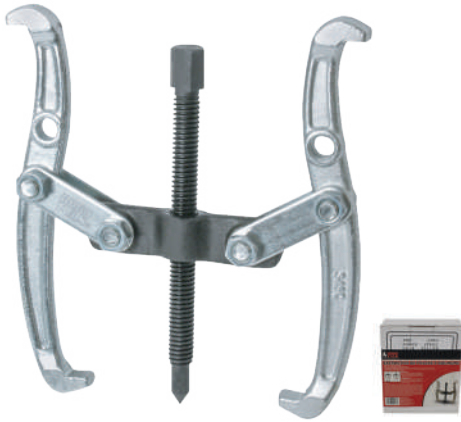
EXTRACTOR DE POLEAS 2 QUIJADAS