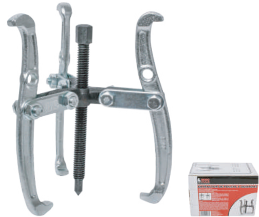
EXTRACTOR DE POLEAS 3 QUIJADAS